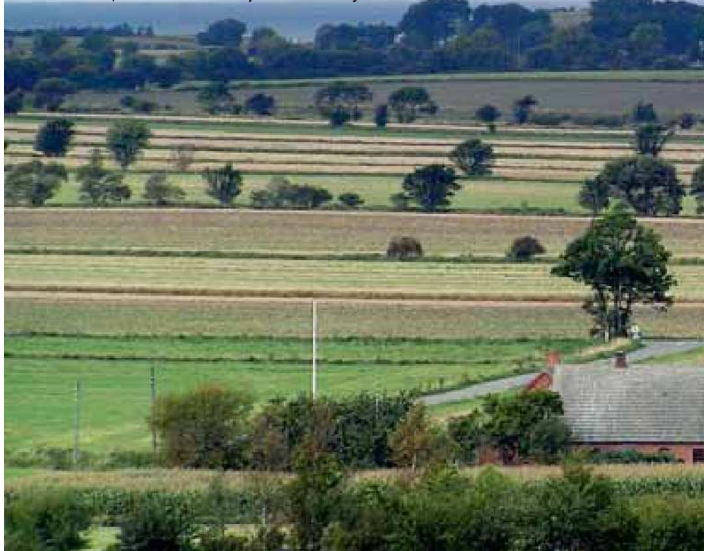
Jo flere skel, desto bedre biotoper for flora og fauna.

René Didriksen: – På Sjælland oplever jeg en meget stor interesse for biotopplanerne og regelsættet vedrørende de nye udsætningsregler. Vi har truffet aftaler om udarbejdelse af biotopplaner for mange ejendomme og er gået i gang med at udarbejde dem. Sideløbende kommer der jævnligt nye forespørgsler. Ud over selve planerne rekvireres jeg til at holde